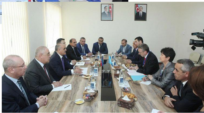
Встреча с Салимом Муслумовым, министром труда и социальной защиты населения