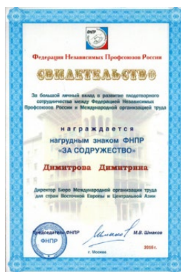
Директора Бюро МОТ наградили почетными знаками РСПП и ФНПР