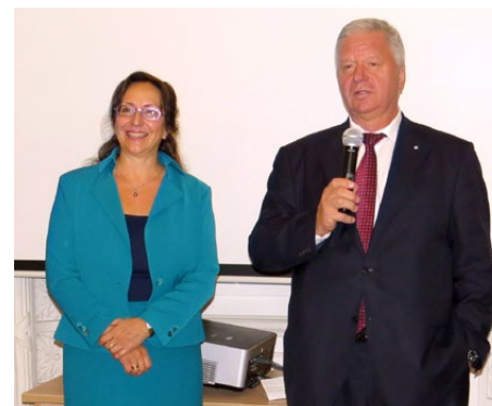
С председателем Федерации независимых профсоюзов России Михаилом Шмаковым