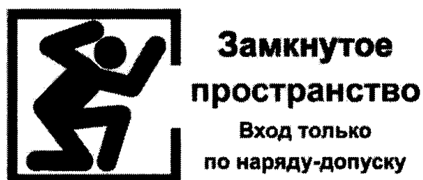
Рекомендуемый знак "ОЗП"

3. На арматуре блокировок должны быть вывешены таблички: "Не открывать! Работают люди"; "Не закрывать! Работают люди"; на ключах управления электроприводами отключающей арматуры: "Не включать! Работают люди"; на месте