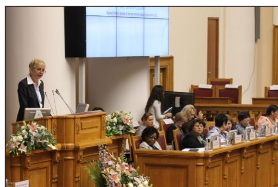
Сандра Поласки на трибуне Евразийского женского форума